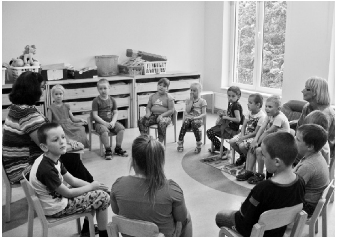
Edimene keelepese päev 17. septembrel Karksi-Nuia lasteaia Orave rühmän.