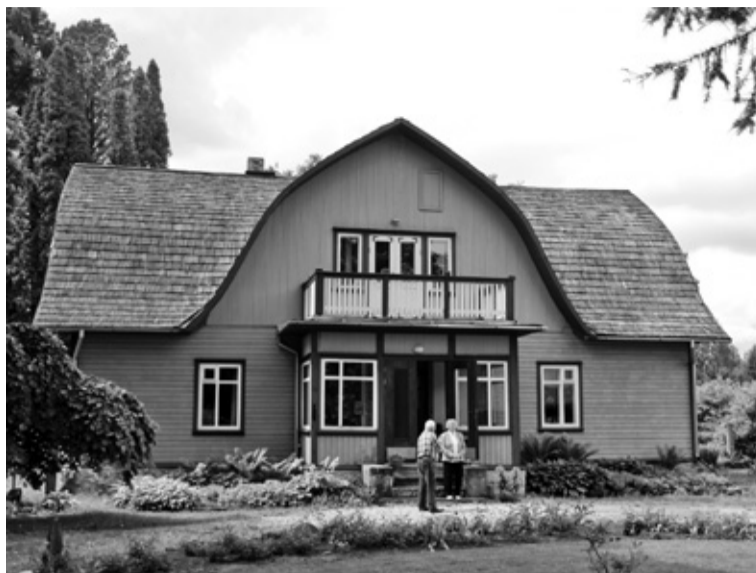
Murri äärbän om iluste kõrran ja uviliste jaos om usse iki valla.

Suure tüü ja projekte abige sai Murri äärbän 2005. aastel lõpus kõrda. Valmis sai eluone, parandet kaju, ait-keller, ait-kuurialune, sanna man läitsive tüü